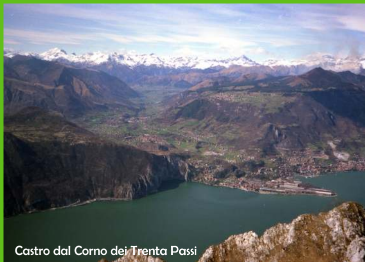
Castro dal Corno dei Trenta Passi

SEB1 Via del Cantiere 15/a 24065 Lovere - lago d'Iseo (BG) tel. 035 983733 cell. 366 4567 189 WEB: www.seb1.it