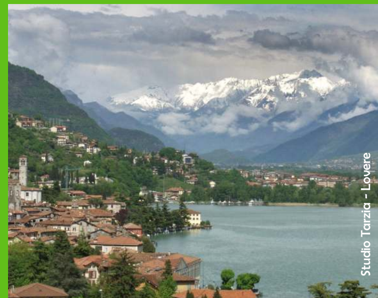
Studio Tarzia - Lovere